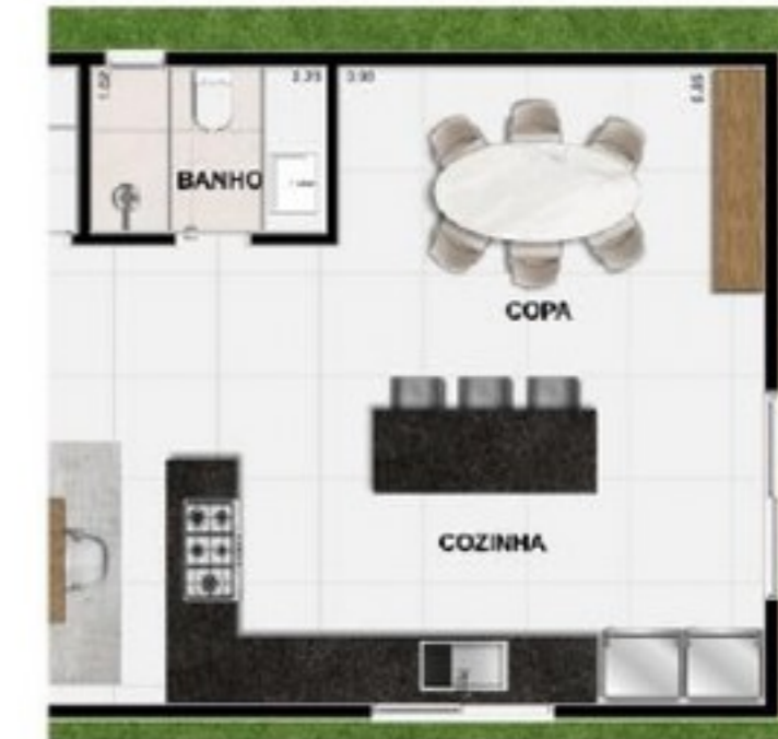
OPÇÃO DE AMPLIAÇÃO DA COZINHA