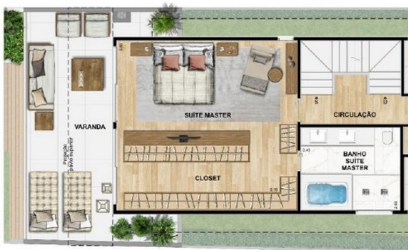
OPÇÃO DE AMPLIAÇÃO DA SUÍTE MASTER