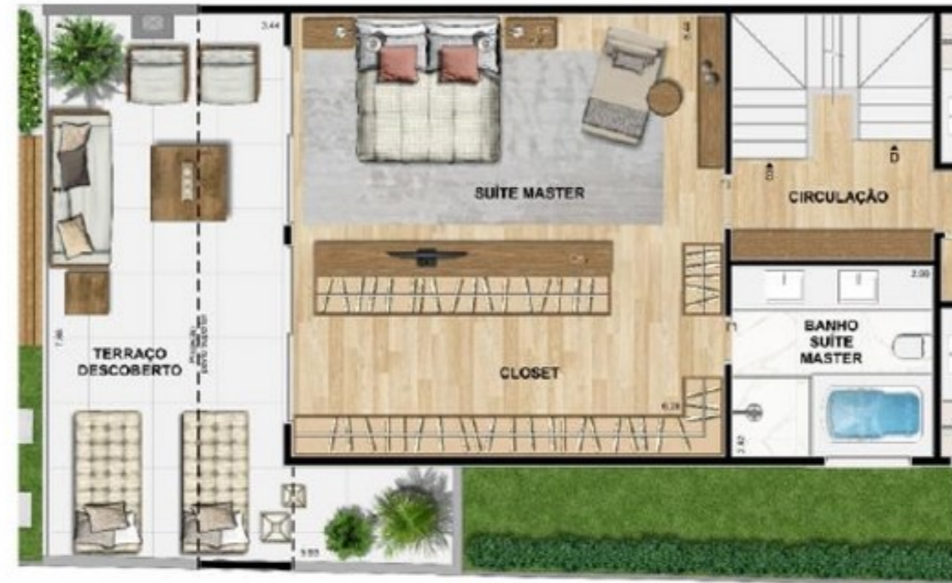
OPÇÃO DE AMPLIAÇÃO DA SUÍTE MASTER