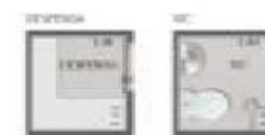
Spotlight Jardim Botafogo Ed. Spotlight II 1º Pavimento Unidade 105 - 170,50m 2