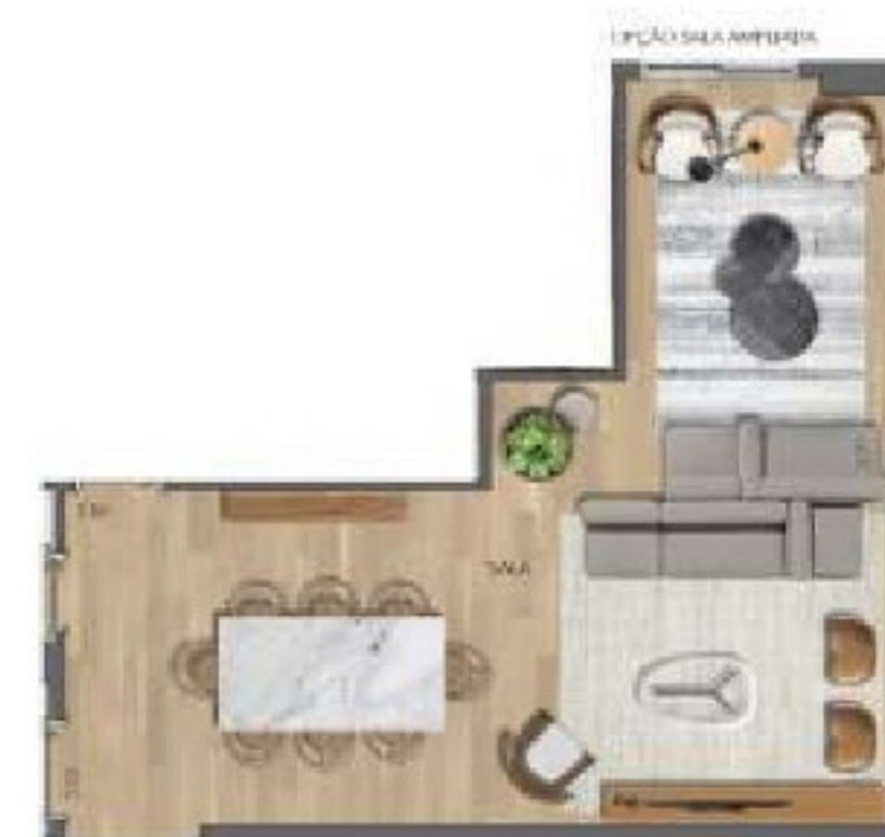
Spotlight Jardim Botafogo Ed. Spotlight II Unidade 202 a 802 - 137,80m 2 privativos Unidade 205 a 805 - 137,80m 2 privativos