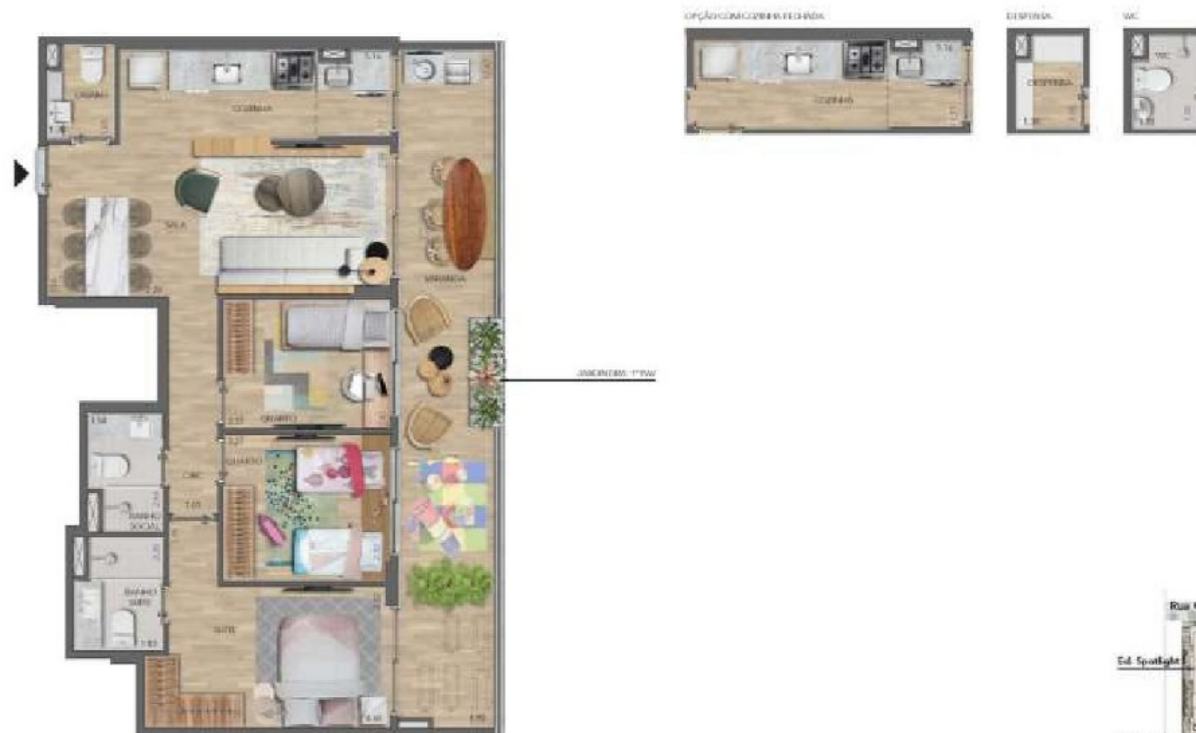
Spotlight Jardim Botafogo Ed. Spotlight II 1º Pavimento Unidade 103 e 104 - 99,41m 2