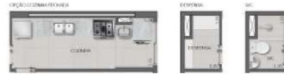
Spotlight Jardim Botafogo Ed. Spotlight I 2º a 8º Pavimento Unidade 202 a 802 - 131,33m 2