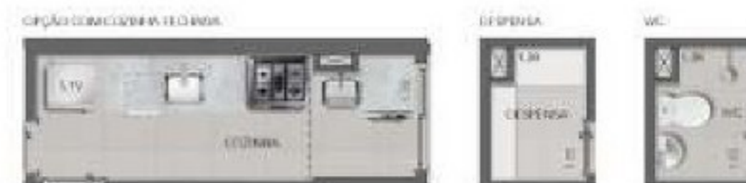
Spotlight Jardim Botafogo Ed. Spotlight II Unidade 203 a 803 - 96,88m 2 privativos Unidade 204 a 804 - 96,88m 2 privativos